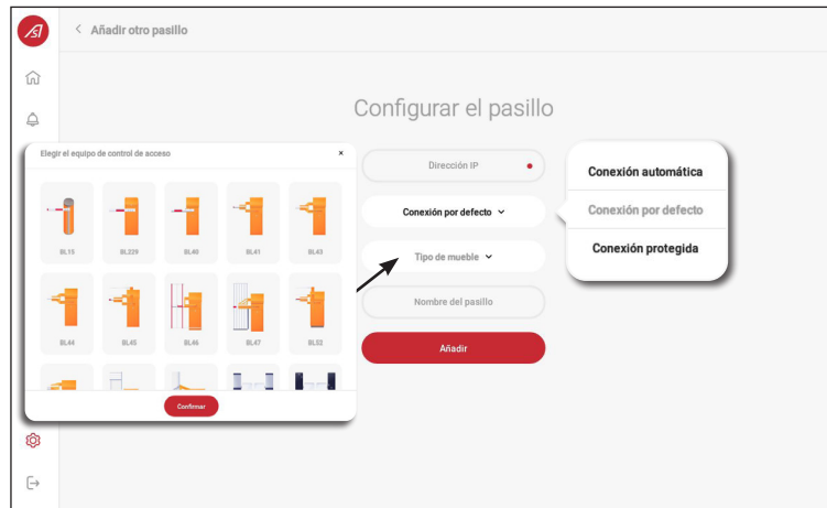
Creación de un nuevo equipo dentro de un conjunto